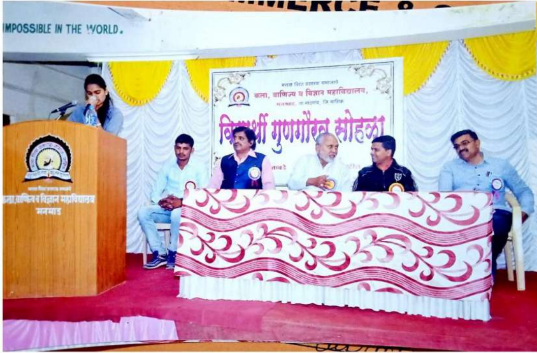
Students Expressing their experiences and views