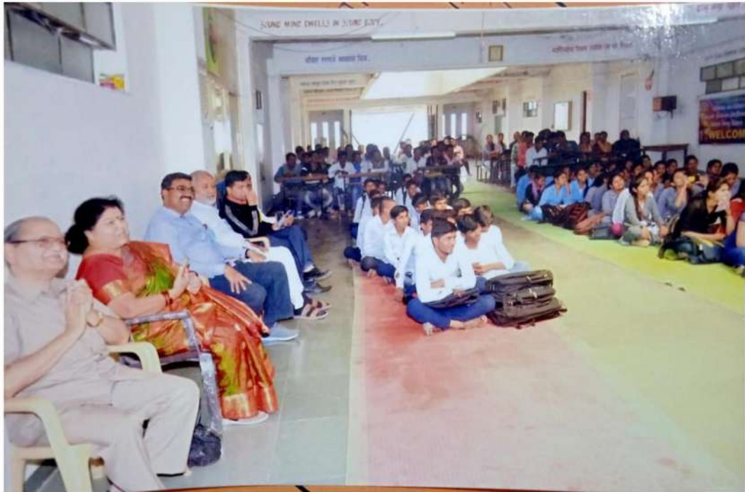
Participants viewing and enjoying