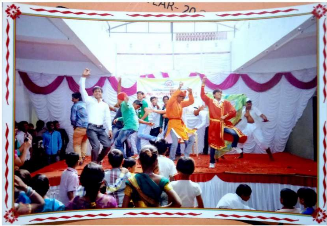
Students Performing On the Occasion.