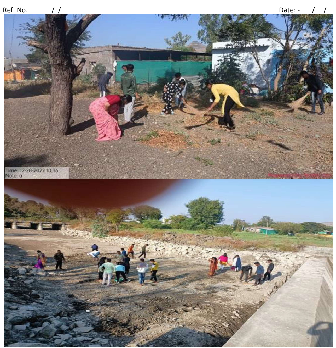
Village Cleaning Drive

Tal. Nandgaon, Dist. Nashik (M.S.) 423104 Affiliated to Savitribai Phule Pune University, Pune (ID No-PU/NS/AC/108/2007) AISHE : C-42066 Email: - <u>mvpprinmanmad@gmail.com</u> Telephone: - 02591-225364