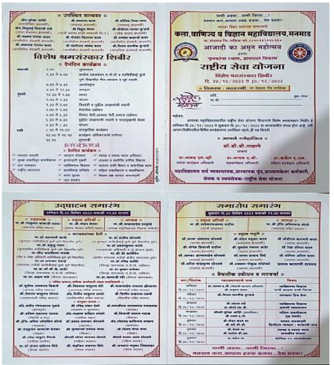
NSS CAMP PROGRAMME SHEDULE