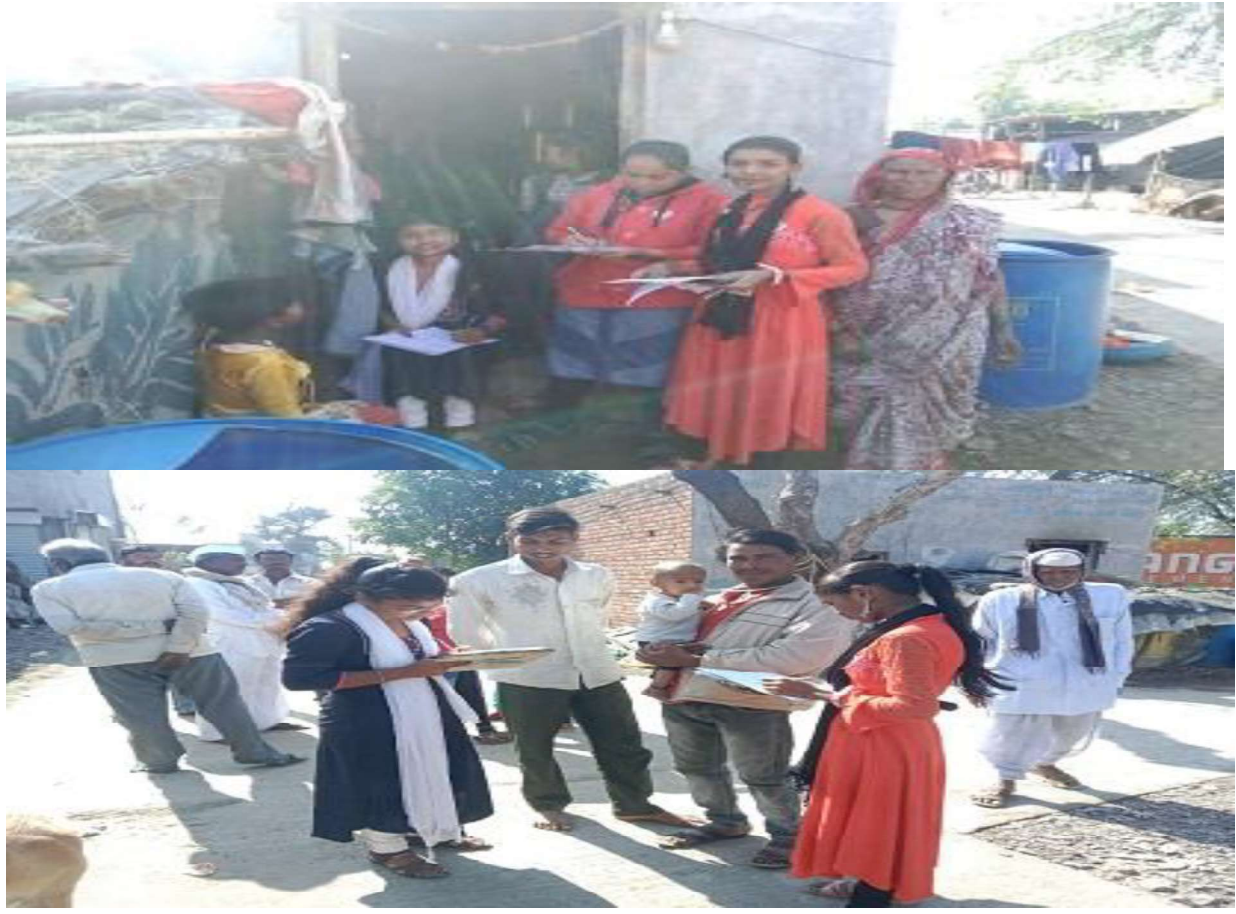
Unnat Bharat Sco-Economic Survey By Volunteers